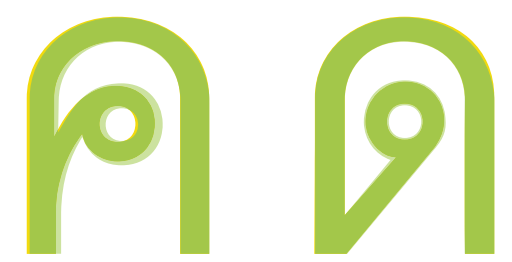
ค, ด หัวจะถูกลดขนาดให้บางลงเพื่อเพิ่มพื้นที่ว่างให้ดูโปร่งขึ้น

ในอักษรบางตัวของชวนพิมพ์เดิม เช่น ข และ ท แม้จะไม่สับสนกับตัวใด ๆ แต่เพื่อให้กวาดสายตาอ่านได้ง่าย จึงได้เพิ่มขนาดส่วนหัวขมวดม้วนของ ข. และเพิ่มความทแยงของเส้นกลาง ท. ให้ดูชัดเจนนยิ่งขึ้น.