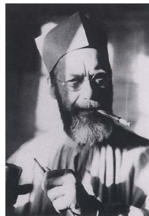
Eric Gill นักออกแบบตัวพิมพ์ชาวอังกฤษ (1882-1940)

Being the Thai equivalent of Gill Sans, DB Gill Siam contains the characteristics of its Roman antecedent: features such as the vertical termination of curved strokes, or the square, horizontal ear of the lower-case “g” (which is adopted for the end strokes, or “tails” of Thai characters). Readability of the font is encouraged by its looser tracking as well as in its careful design of discernible letterforms to minimize confusion.