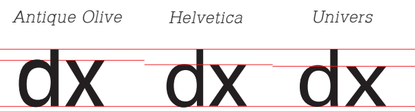
เปรียบเทียบที่ขนาดความสูง ascender เท่ากัน x ของ Antique Olive จะสูงที่สุด