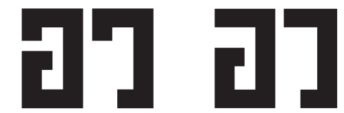
แบบสยามสแควร์

มันสามารถ คงความจริงใจ โปร่งใสไว้ได้ ขณะเดียวกัน รายละเอียดยังเป๊ะ ไม่มีนิ้ว